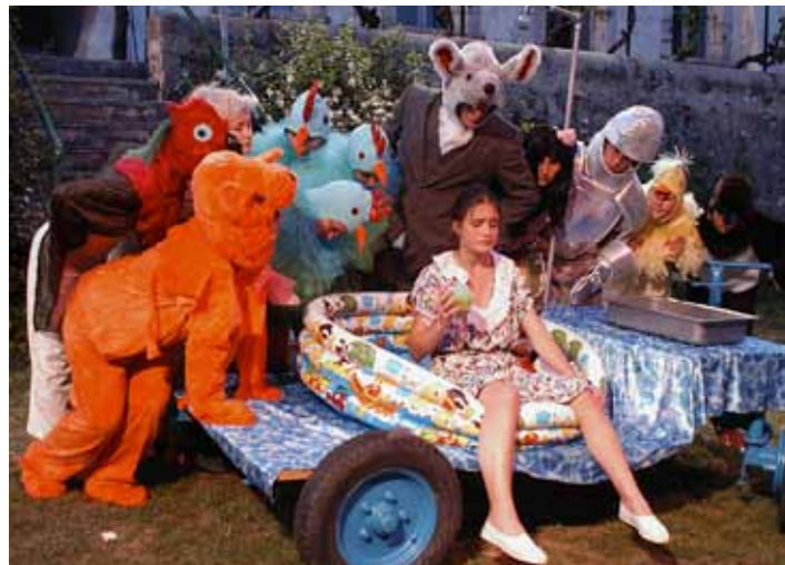
2005: Alice au Pays des Merveilles