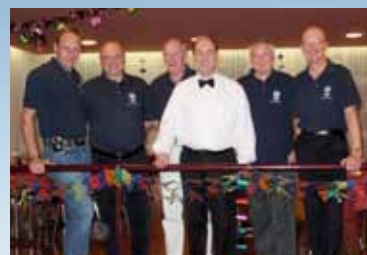
L'amicale des Sapeurs-Pompier lors de la soirée de St-Sylvestre 2010

Avant tout, nous tenons à contribuer à la vie associative de Begnins, par notre soutien aux manifestations tenues dans l'un des plus beaux villages de la Côte: forts de plus de trente membres, nous participons activement au Marché villageois en été, soutenons les pompiers actifs au Téléthon et sommes là pour le Noël dans la rue, en décembre. Il nous tient particulièrement à cœur d'organiser la soirée du 31 décembre au Centre de Fleuri, pour donner la possibilité aux habitants de Begnins et environs d'y prendre part dans un cadre festif et joyeux, sans dépenses excessives. Nous avons de la chance de pouvoir le faire avec le grand soutien de la Commune.