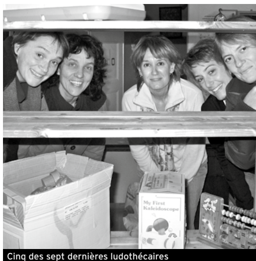
Cinq des sept dernières ludothécaires