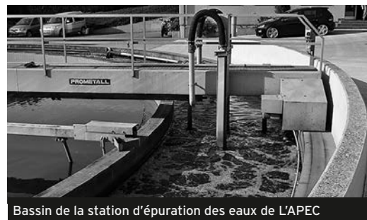
Bassin de la station d'épuration des eaux de l'APEC

Le traitement suivant, dit «traitement biologique», a pour but d'éliminer la pollution organique biodégradable. Après avoir traversé deux disques biologiques, l'eau arrive dans un bassin où prolifèrent des micro-organismes qui transforment les matières organiques de l'eau usée en boues minérales décantables. Ensuite, ces boues sont séparées de l'eau, qui est alors épurée à nonante pour cent. Cette phase de traitement est la plus importante et aussi la plus sensible. Il faut donc absolument éviter de déverser à l'égout les huiles, les graisses, les acides et tout autre produit qui