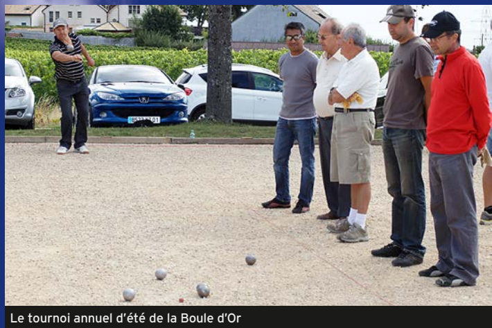
Le tournoi annuel d'été de la Boule d'Or

Le 26 août dernier, le club de pétanque de Begnins La Boule d'Or a organisé son tournoi annuel. Les acteurs du jour se sont affrontés en toute simplicité sur le gravier du parc de Fleuri. Les parties se sont enchaînées entre joueurs néophytes ou confirmés, anciens ou plus jeunes. Chaque participant a eu sa chance lors des compétitions: tournoi en triplette et concours de pointage. Pour preuve, le vainqueur du concours de pointage, qui est âgé de huitante-sept ans. Parmi les vingt-et-une triplettes concourantes, la finale a été remportée par un trio familial (père, frère et fils) malgré la présence de joueurs expérimentés, membres du club de la Nyonnaise. La seule critique exprimée a été l'absence de pastis à la buvette.