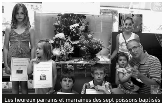
Les heureux parrains et marraines des sept poissons baptisés

À l'automne 2011, la pharmacie de Begnins a non seulement subi une cure de jouvence bien méritée, mais s'est également fait de nouveaux amis. Elle héberge désormais des pensionnaires pour le moins originaux.