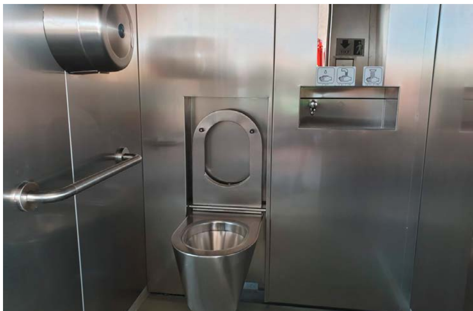
Image d'illustration de l'intérieur des futures toilettes publiques.

Quand on demande à Éric Halde- mann quels sont les avantages de ces nouvelles toilettes, sa réponse est on ne peut plus