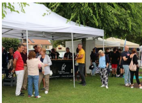
Les Begninois heureux de se retrouver