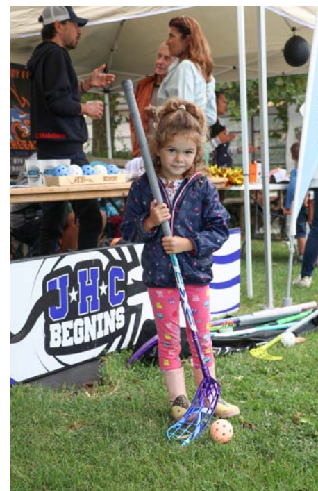
Une jeune fan d'unihockey