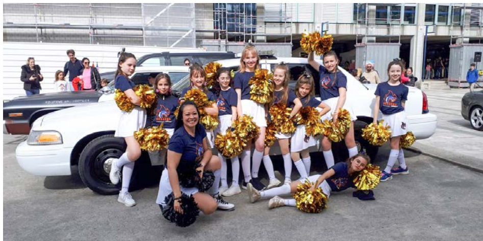
Les Dragons Cheerleaders animent divers d'événements sportifs dans toute la région.