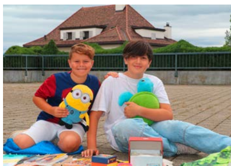
Le troc des enfants sur l'esplanade