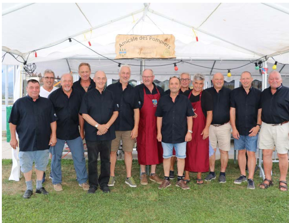
Les membres de l'Amicale des Pompiers, fidèles au poste et heureux d'être ensemble

Le samedi 17 août, l'Amicale des sapeurs-pompiers renouvelait son invitation gourmande