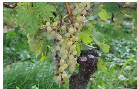
À la veille des vendanges, Raphaël Sordet constate des dommages importants sur ses terres viticoles. En haut à droite, une grappe détruite par le mildiou. En bas à droite, des raisins blessés par la grêle.

Jusqu'à la mi-juillet, les vigneronns ont dû faire face à des pluies importantes, propices aux moisissures. Pour compléter ce scénario catastrophe, la grêle a endommagé le raisin par endroits.